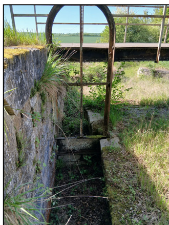
L'ancien trop plein