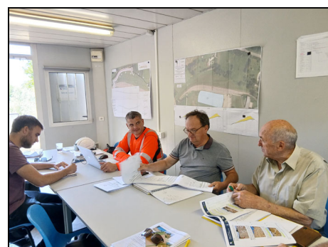
Réunion de chantier le lundi dans les bureaux à la digue