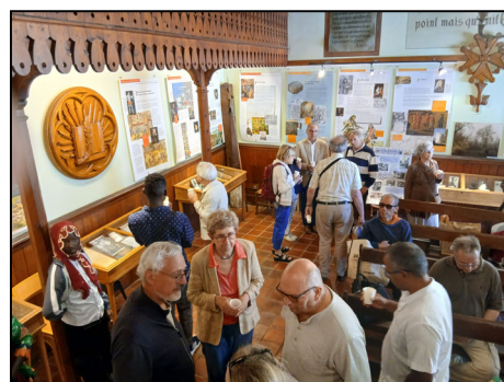
Visite du musée le 14 juin

Le musée a donc rouvert ses portes après la réinstallation des vitrines et depuis début avril 112 personnes l'ont visité. La surprise a été la visite de deux personnes venues de Nouvelle Zélande ! Ces habitants de Auckland faisaient un séjour en Europe sur les traces de leurs ancêtres protestants qui avaient émigré après le Massacre de Wassy de 1562. L'une des personnes a retrouvé le nom de son ancêtre sur la plaque rappelant les 70 victimes du Massacre. Elle a écrit quelques mots dans le livre d'or du musée qui contient de nombreux messages laissés par des visiteurs venus de pays lointains : Etats-Unis, Australie, Corée, etc...La fête annuelle du Temple de Wassy a eu lieu le 14 juin