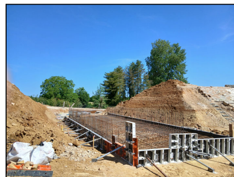
Percement du nouveau trop plein en mai/juin

L'ancien trop plein qui n'avait plus d'utilité depuis longtemps est conservé pour le souvenir. Le nouveau trop plein a été creusé du côté ouest du barrage par la société TERELIAN. Il a été bétonné par la société SETHY. Pendant le mois de mai, le chantier a bénéficié d'un temps sec qui a évité aux engins de manœuvrer dans la boue, mais le temps caniculaire a rendu le travail pénible pour les hommes.